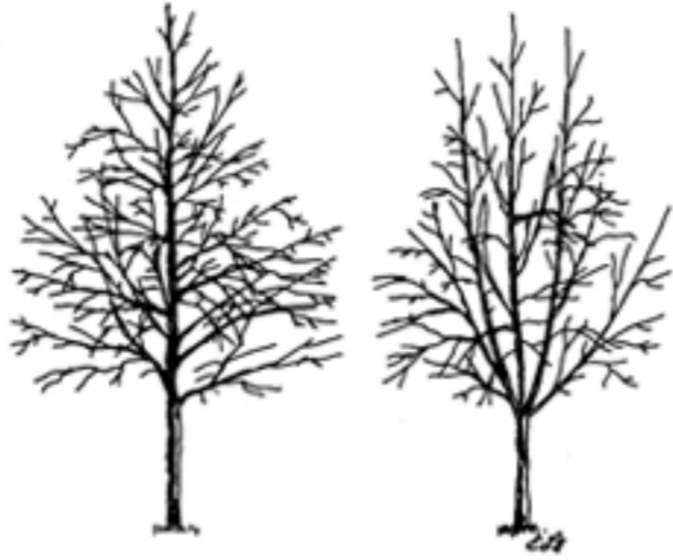
Figura 1. Buena estructura del árbol (izquierda); mala estructura (derecha).

Los árboles que crecen hasta ser grandes son más sólidos estructuralmente y menos costosos de mantener cuando están capacitados con un líder central dominante que se extiende 30 pies o más hasta la corona del árbol (Fig. 1, izquierda). Ramas vigorosas y tallos verticales que compiten con el líder central pueden llegar a debilitarse (Fig. 1, derecha).