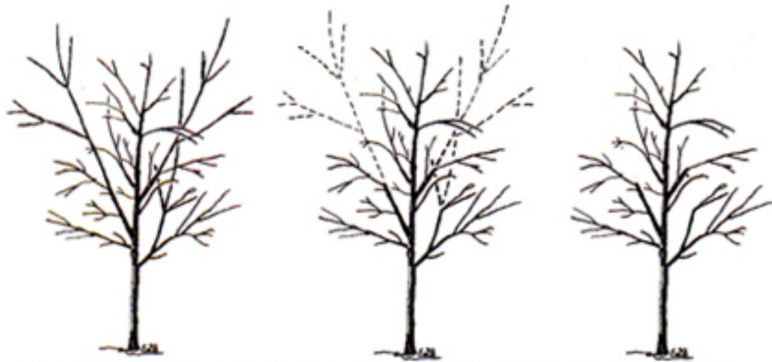
Figura 2. Recorte los tallos que compiten con el líder para mejorar la estructura del árbol.

Los árboles con ramas espaciadas a lo largo del líder central, o tronco, (Fig. 1, izquierda) son más fuertes que los árboles con ramas agrupadas (Fig. 1, derecha). Poda los árboles recién plantados a un líder central recortando los tallos que compiten con el líder central (Fig. 2). Todas las ramas y los tallos deben ser más cortos que el líder central después de haber sido podados (Fig. 2, derecha).