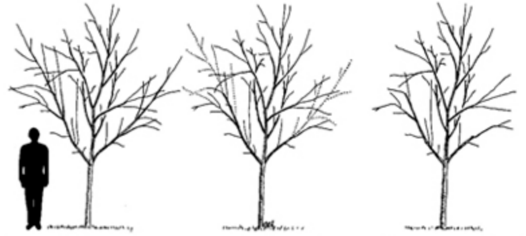
Figura 4. Recorte las ramas bajas más grandes para estimular el crecimiento en el líder y mejorar la estructura del árbol.

Recorte las ramas bajas más grandes cuando el árbol está pequeño para mantener las ramas pequeñas (Fig. 4). Estas ramas recortadas pueden ser removidas más tarde para que haya más espacio. La eliminación de las ramas pequeñas crea heridas menores con menos posibilidad de decadencia.