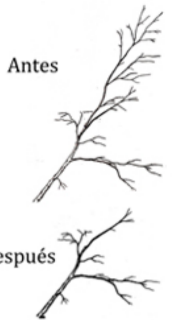
Figura 5. Reduzca el tallo a una rama lateral viva para retrasar su crecimiento.

La mejor manera de recortar tallos y ramas grandes o largas es cortando detrás de la rama lateral viva (Fig. 5). Esto retrasa el crecimiento en las partes podadas y estimula el crecimiento en el líder dominante creando una estructura fuerte.